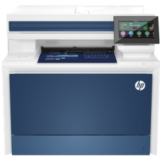
Impressora HP Color LaserJet Pro MFP 4303dw