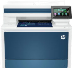
Impressora HP Color LaserJet Pro MFP 4303fdw